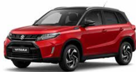
Bright Red & Cosmic Black Pearl Metallic (A9H)***