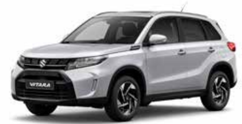
Silky Silver Metallic (ZCC)**