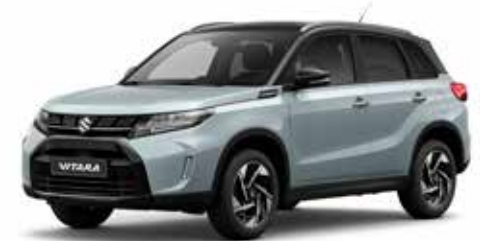
Ice Grayish Blue Metallic & Cosmic Black Pearl Metallic (DBF)***

* Standaard op Comfort, Select en Style.