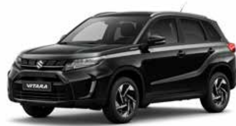
Cosmic Black Pearl Metallic (ZCE)**