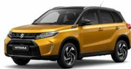
Solar Yellow Pearl Metallic & Cosmic Black Pearl Metallic (DBH)***