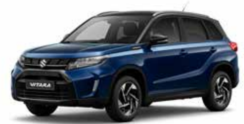
Sphere Blue Pearl Metallic & Cosmic Black Pearl Metallic (FC2)***