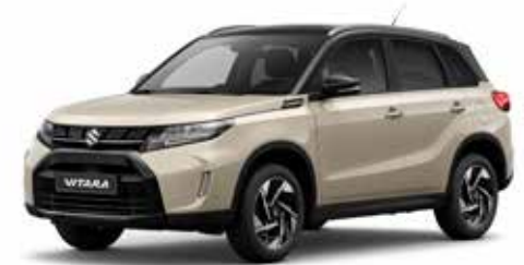
Savanna Ivory Metallic & Cosmic Black Pearl Metallic (A9N)***