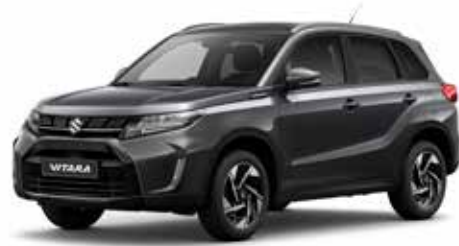
Titan Dark Grey Pearl Metallic (ZZZ)**

Maak je keuze uit de 10 kleur- mogelijkheden die voor de Vitara leverbaar zijn. Wil je echt opvallen? Dan kies je voor een van de 5 two-tone kleurcombinaties.