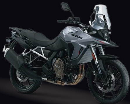
QEB: Metallic Oort Gray