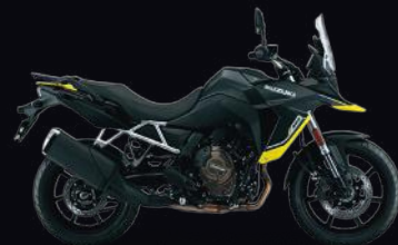
YKV: Metallic Mat Black