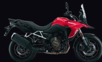
YYG: Candy Daring Red