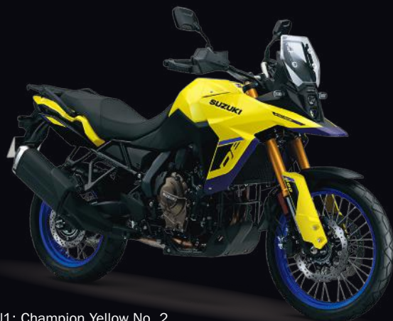
YU1: Champion Yellow No. 2