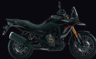
YVB: Glass Sparkle Black