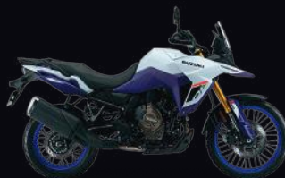
QU2: Pearl Tech White