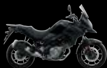
YVB: Glass Sparkle Black (A)