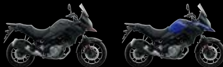
YUD: Solid Iron Grey (A) YKY: Pearl Vigor Blue (A)