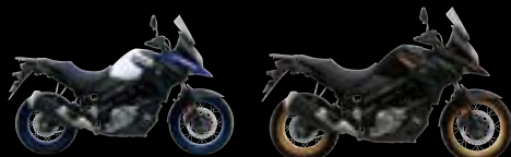
JWN: Pearl Vigor Blue / Pearl Brilliant White (XT) YVB: Glass Sparkle Black (XT)