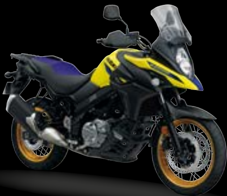
YU1: Champion Yellow No.2 (XT)