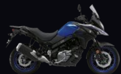
CFR: Pearl Vigor Blue / Metallic Mat Sword Silver (XT)