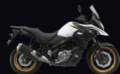
YUH: White (XT)