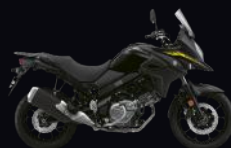
YVB: Glass Sparkle Black (A)