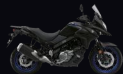
YVB: Glass Sparkle Black (XT)