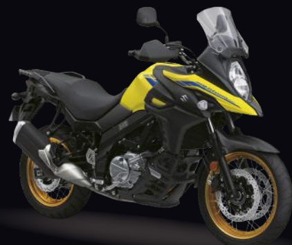
YU1: Yellow (XT)