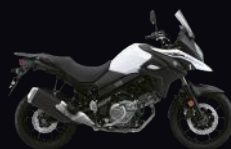
YUH: White (A)