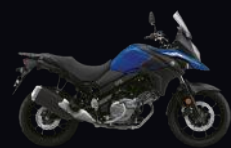
YKY: Pearl Vigor Blue (A)