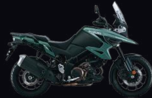
CWY: Metallic Mat Steel Green/ Metallic Mat Black No.2