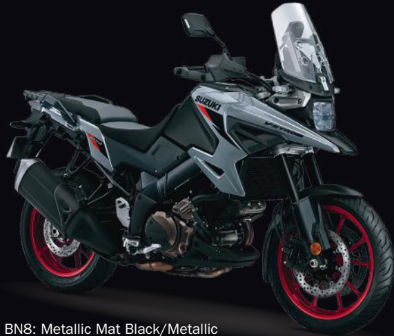
BNS: Metallic Mat Black/Metallic Cort Gray