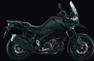
C4X: Glass Sparkle Black/ Metallic Mat Black No.2