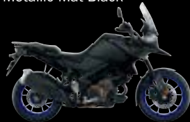
A3X: Metallic Mat Black / Glass Sparkle Black