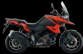
CGH: Glass Blaze Orange / Metallic Mat Black