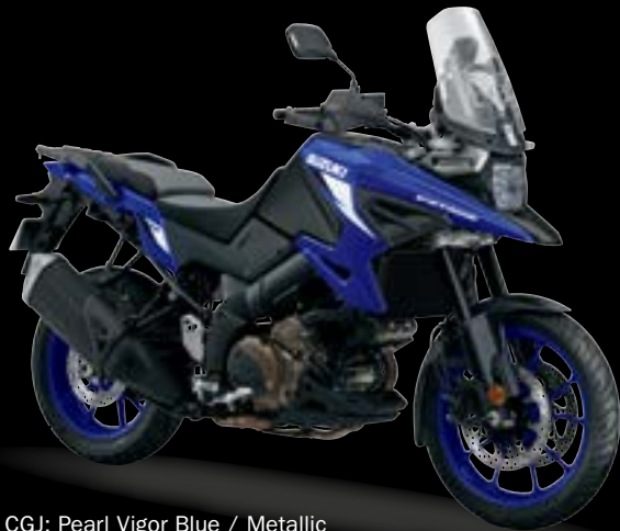
CGJ: Pearl Vigor Blue / Metallic Mat Black