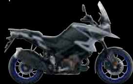
CQX: Glass Mat Mechanical Grey / Metallic Mat Black