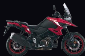
BNR: Red / Black