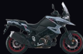
CB8: Grey / Black