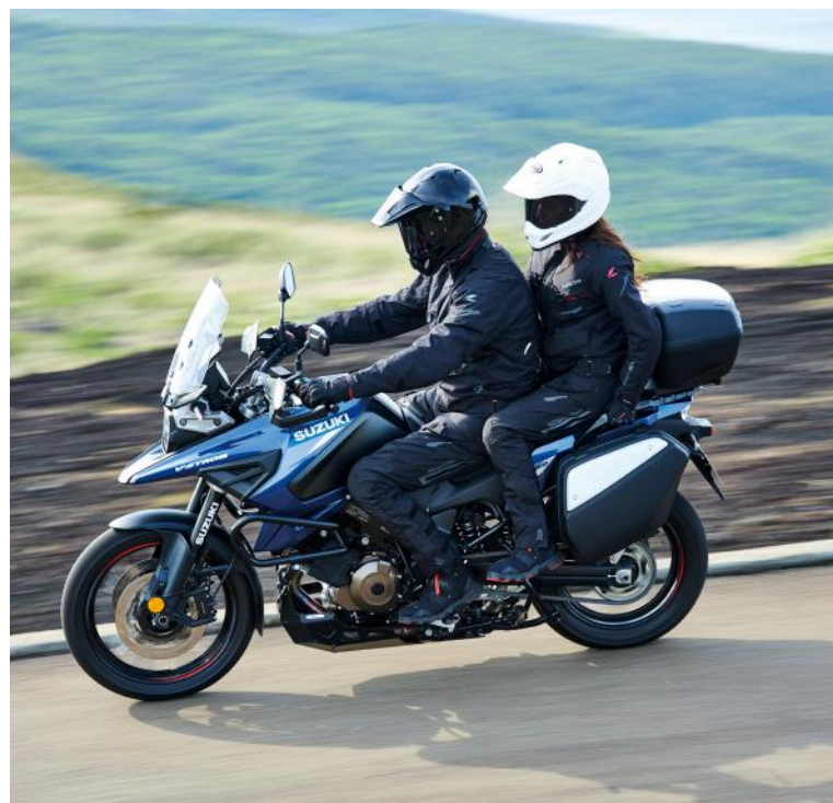
Het getoonde model is niet voorzien van een Accessoire Pack maar van diverse accessoires. Afbeelding enkel ter illustratie.