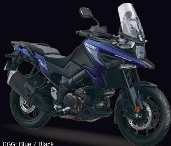
CGG: Blue / Black