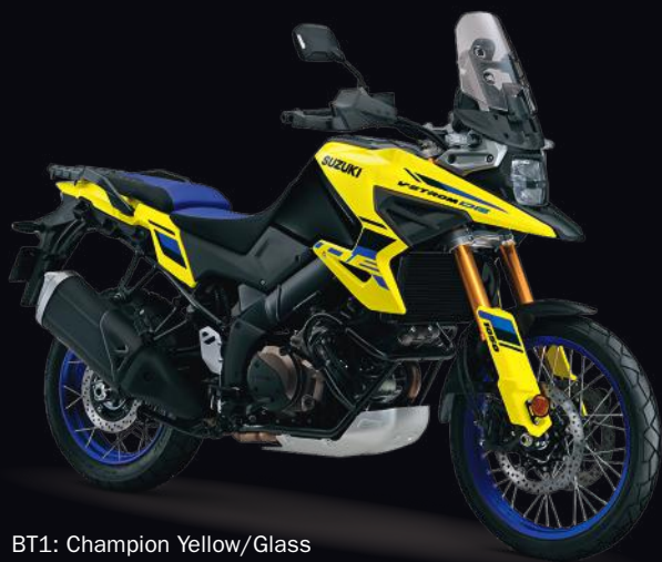
BT1: Champion Yellow/Glass Sparkle Black