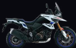
CK6: Pearl Tech White / Glass Sparkle Black