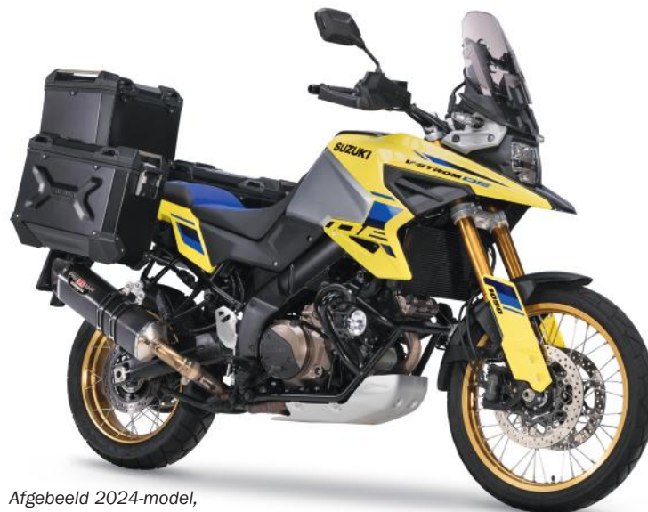
Afgebeeld 2024-model, inclusief optionele Yoshimura uitlaatdemper.