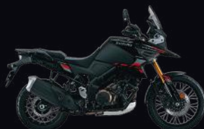
C4X: Glass Sparkle Black / Metallic Mat Black No.2