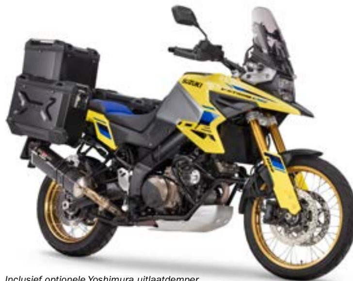
Inclusief optionele Yoshimura uitlaatdemper.