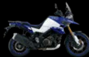
JWN: Blue / White