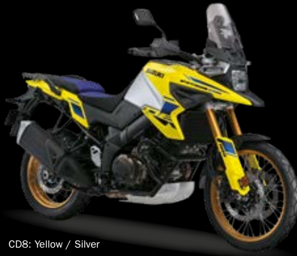
CD8: Yellow / Silver