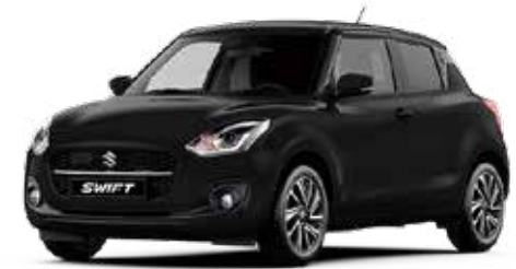
Super Black Pearl