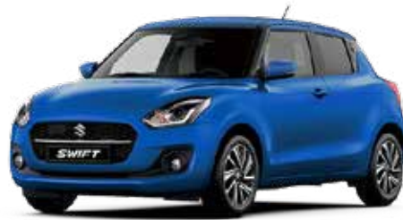
Speedy Blue Metallic

De Suzuki Swift is leverbaar in verschillende kleuren, waaronder een aantal two-tone kleuren. Vind je het lastig om een goede kleur te kiezen? Kom dan langs in de showroom om de kleuren eens in het echt te bekijken, voordat je een beslissing neemt.