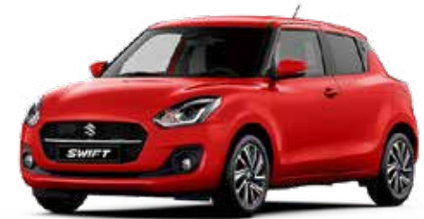
Burning Red Pearl Metallic