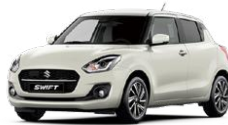
Pure White Pearl