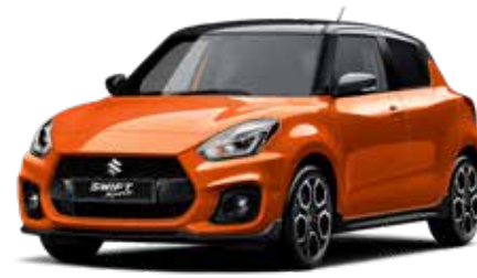
Flame Orange Pearl Metallic & Super Black Pearl