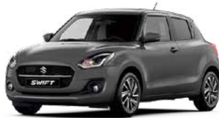
Mineral Gray Metallic