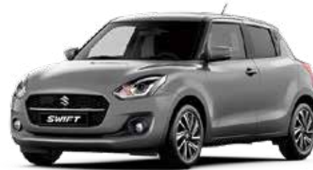
Premium Silver Metallic