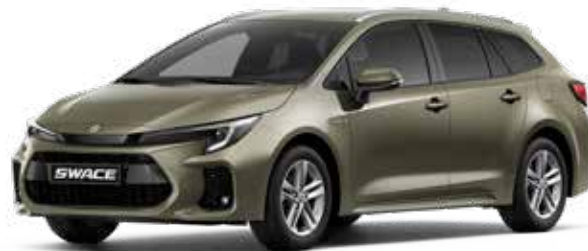
Oxide Bronze Metallic (6X1)**

Kleuren kunnen onder invloed van het drukprocedé afwijken van de werkelijkheid.