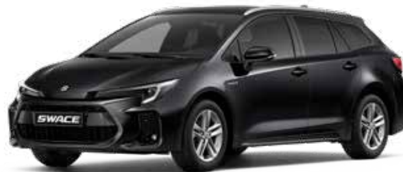
Black Mica (209)**