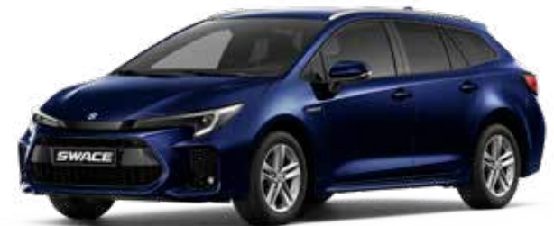
Dark Blue Mica (8X8)**