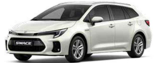
Platinum White Pearl Metallic (089)**