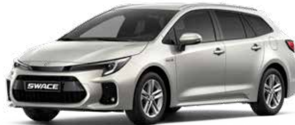
Precious Silver (1J6)**