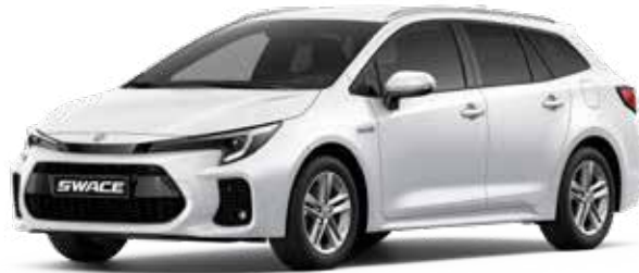
Super White (040)*

De Suzuki Swace is leverbaar met keuze uit 7 exterieurkleuren. Vind je het lastig om een goede kleur te kiezen? Kom dan langs in de showroom om de kleuren eens in het echt te bekijken, voordat je een beslissing neemt.