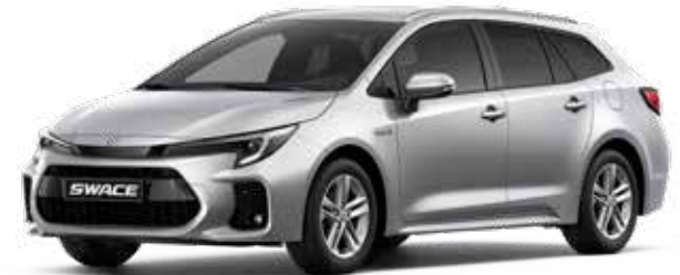
Silver Metallic (1L0)**