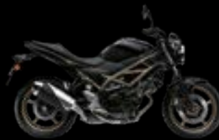
YVB: Glass Sparkle Black