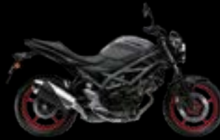
BTH: Black / Dark Grey