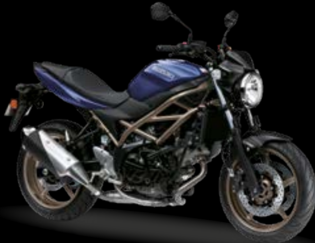
QT8: Metallic Reflective Blue