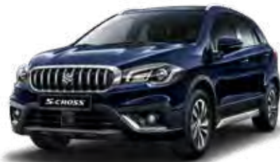
Sphere Blue Pearl Metallic (ZQ4) Optie op Comfort, Select en Style