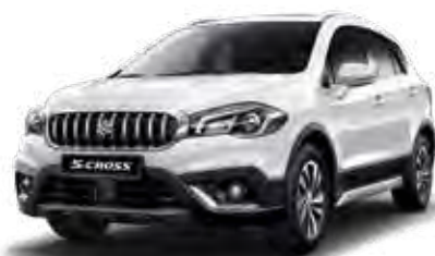
White (26U) Standaard op Comfort, Select en Style

De kleur van een auto is heel persoonlijk. Daarom is de Suzuki S-Cross leverbaar in 9 verschillende kleuren. Vind je het lastig om een goede kleur te kiezen? Kom dan langs in de showroom om de kleuren eens in het echt te bekijken, voordat je een beslissing neemt.