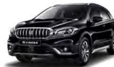
Cosmic Black Pearl Metallic (ZCE) Optie op Comfort, Select en Style