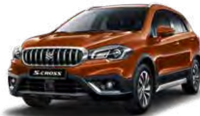
Canyon Brown Pearl Metallic (ZQ3) Optie op Comfort, Select en Style