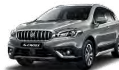
Galactic Gray Metallic (ZCD) Optie op Comfort, Select en Style