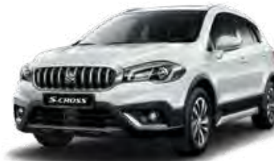
Cool White Pearl Metallic (ZNL) Optie op Comfort, Select en Style