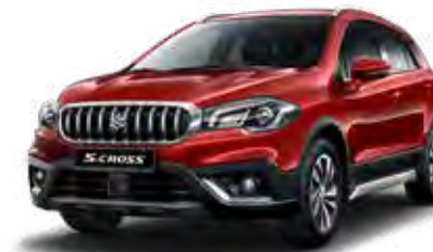
Energetic Red Pearl Metallic (ZQ5) Optie op Comfort, Select en Style

Kleuren kunnen onder invloed van het drukproces afwijken van de werkelijkheid.