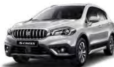
Silky Silver Metallic 2 (ZCC) Optie op Comfort, Select en Style