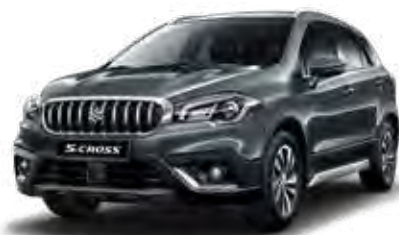
Mineral Gray Metallic 3 (ZQ6) Optie op Comfort, Select en Style