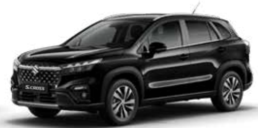
Cosmic Black Pearl Metallic (ZCE) Optie op Comfort, Select en Style