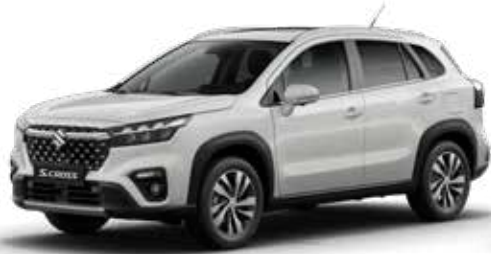
White (26U) Standaard op Comfort, Select en Style

De kleur van een auto is heel persoonlijk. Daarom is de Suzuki S-Cross leverbaar in 8 verschillende kleuren. Vind je het lastig om een goede kleur te kiezen? Kom dan langs in de showroom om de kleuren eens in het echt te bekijken, voordat je een beslissing neemt.