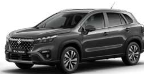
Titan Dark Gray Pearl Metallic (ZZZ) Optie op Comfort, Select en Style

Kleuren kunnen onder invloed van het drukproces afwijken van de werkelijkheid.