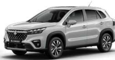
Silky Silver Metallic (ZCC) Optie op Comfort, Select en Style