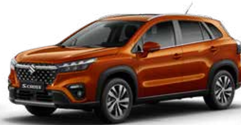
Canyon Brown Pearl (ZQ3) Optie op Comfort, Select en Style