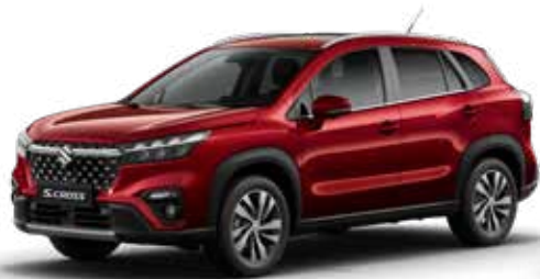
Energetic Red Pearl (ZQ5) Optie op Comfort, Select en Style