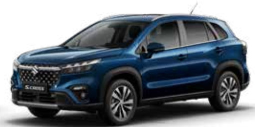
Sphere Blue Pearl (ZQ4) Optie op Comfort, Select en Style