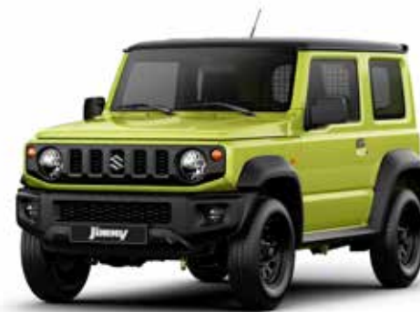
Kinetic Yellow & Blueish Black Pearl (DG5)