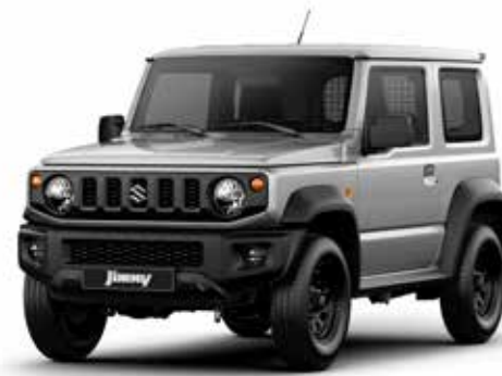
Silky Silver Metallic (Z2S)