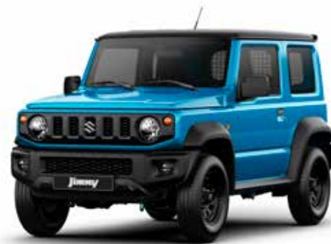
Brisk Blue Metallic & Blueish Black Pearl (CZW)