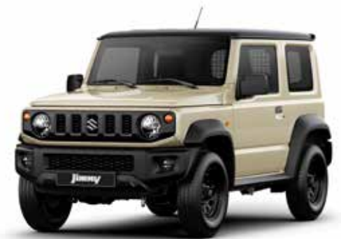
Chiffon Ivory Metallic & Blueish Black Pearl (2BW)