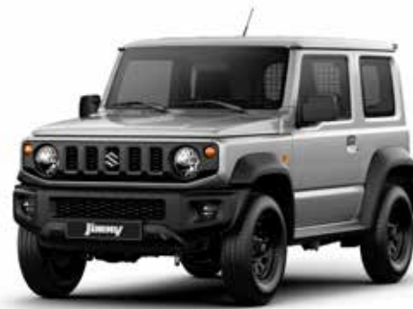
Silky Silver Metallic (Z2S)