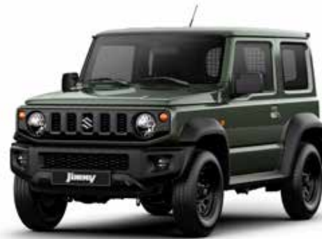
Jungle Green (Z2C)