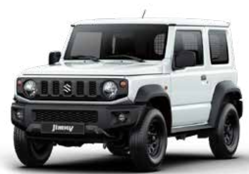
Pure White Pearl (ZVR)