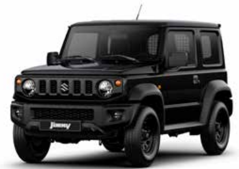
Blueish Black Pearl (ZJ3)