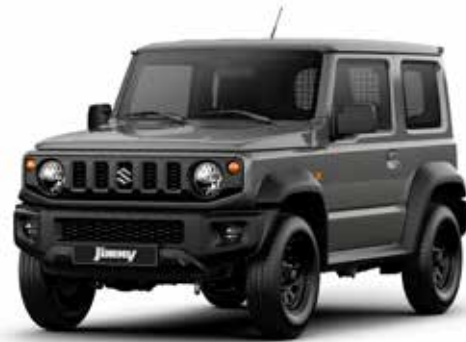
Medium Gray (ZVL)