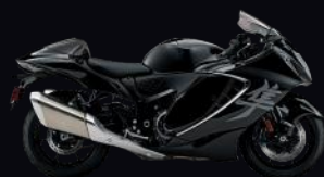
KGL: Black / Black