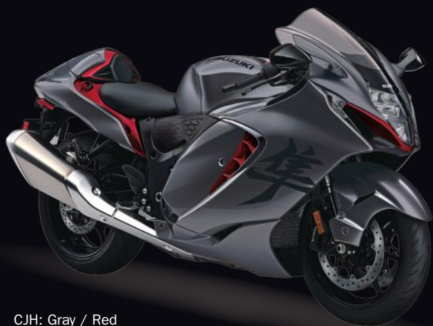
CJH: Gray / Red