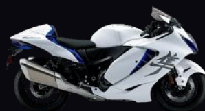
JWN: Blue / White