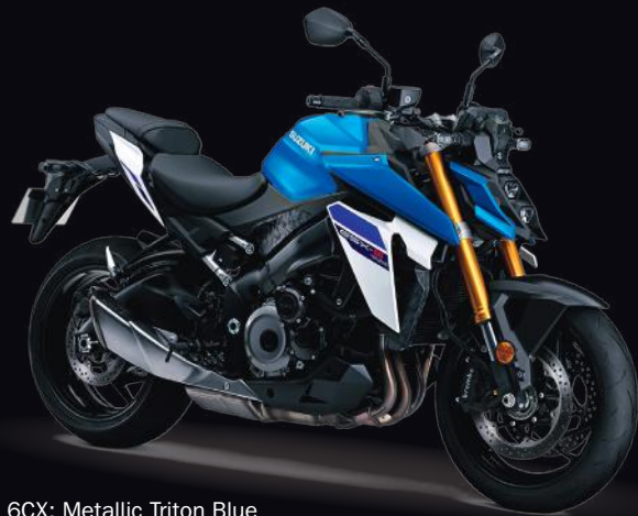
6CX: Metallic Triton Blue