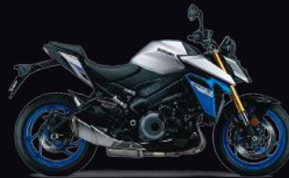
CSX: Metallic Mat Sword Silver