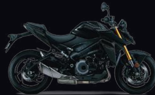
YVB: Glass Sparkle Black