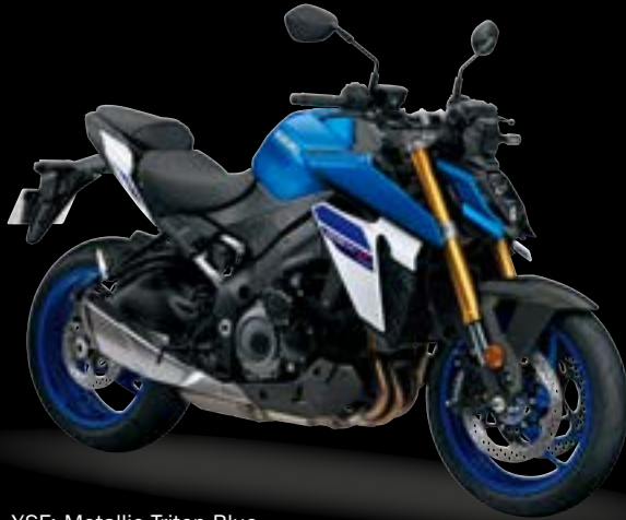
YSF: Metallic Triton Blue