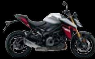
QKA: Metallic Sword Silver