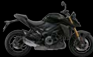
YVB: Glass Sparkle Black