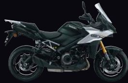
QU5: Pearl Mat Shadow Green