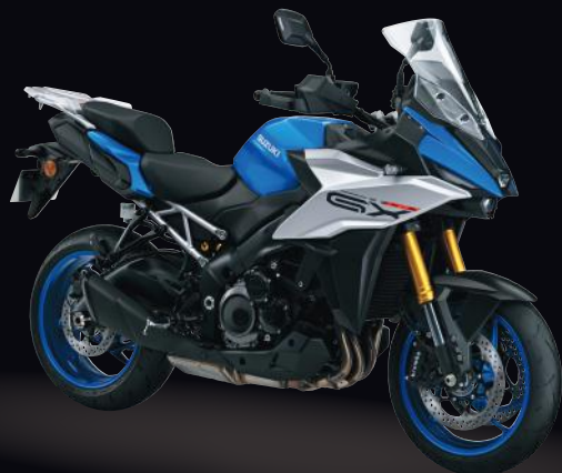
YSF: Metallic Triton Blue