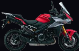
YYG: Candy Daring Red