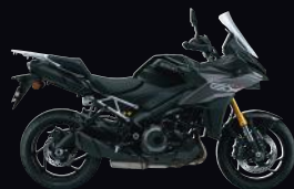
YVB: Glass Sparkle Black