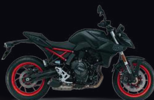
4UX: Metallic Mat Black No.2