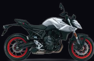
CL9: Metallic Mat Black No.2 / Metallic Mat Sword Silver