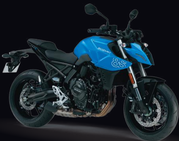
CLB: Glass Sparkle Black / Pearl Cosmic Blue