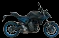
YK7: Metallic Mat Back No2