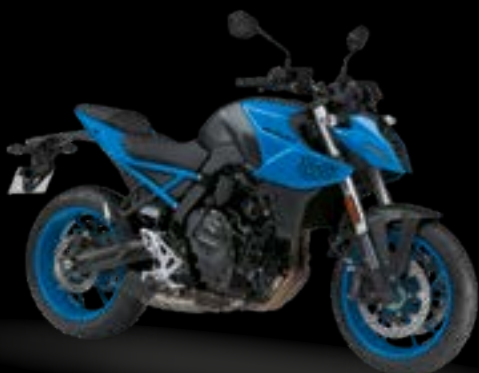
QU1: Pearl Cosmic Blue