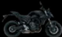
KGL: Glass Sparkle Black