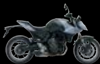
QT7: Glass Mat Mechanical Grey