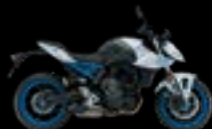
QU2: Pearl Tech White