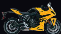
QZY: Pearl Ignite Yellow