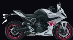
QKA: Metallic Mat Sword Silver