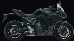
YKV: Metallic Mat Black No.2