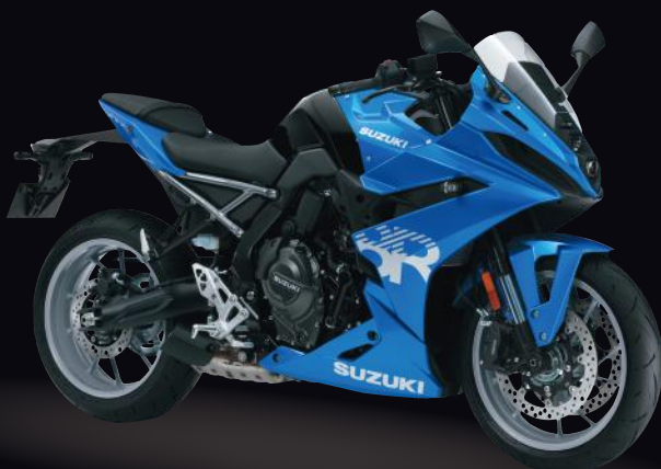
YSF: Metallic Triton Blue