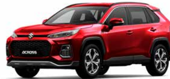
Sensual Red Mica (3T3)**

Kleuren kunnen onder invloed van het drukprocedé afwijken van de werkelijkheid.