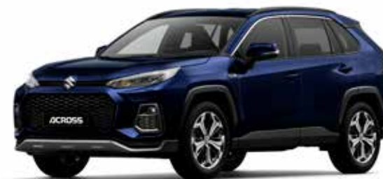
Dark Blue Mica (8X8)*