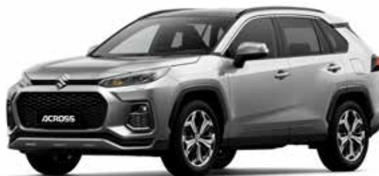
Silver Metallic (1D6)*

De Suzuki Across is leverbaar in 6 exterieurkleuren. Vind je het lastig om een goede kleur te kiezen? Kom dan langs in de showroom om de kleuren eens in het echt te bekijken, voordat je een beslissing neemt.