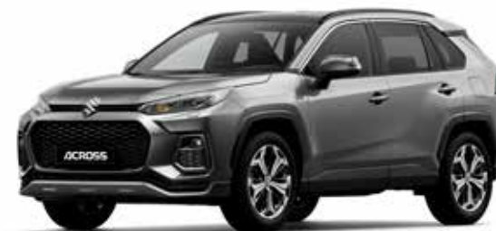
Gray Metallic (1G3)*