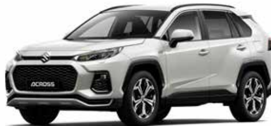
Platinum White Pearl Metallic (089)**