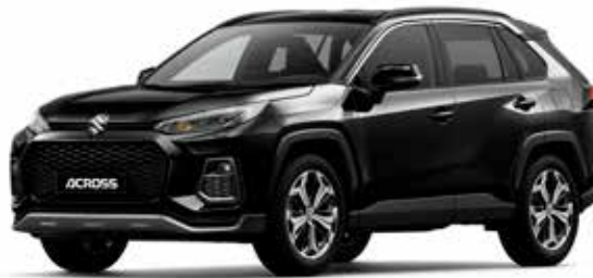
Attitude Black Mica (218)*