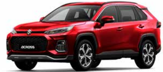
Sensual Red Mica (3T3)**

Kleuren kunnen onder invloed van het drukprocedé afwijken van de werkelijkheid.