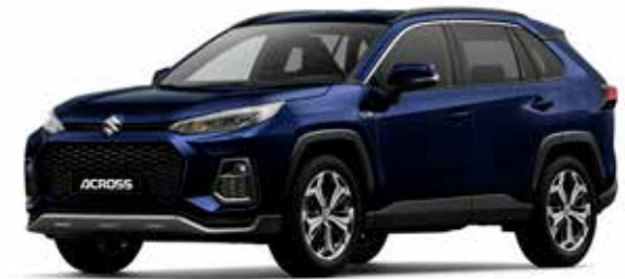
Dark Blue Mica (8X8)*