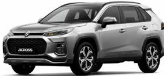
Silver Metallic (1D6)*

De Suzuki Across is leverbaar in 6 exterieurkleuren. Vind je het lastig om een goede kleur te kiezen? Kom dan langs in de showroom om de kleuren eens in het echt te bekijken, voordat je een beslissing neemt.