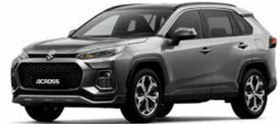
Gray Metallic (1G3)*