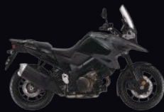
BTH: Black / Dark Grey