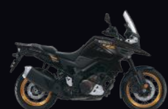
YVB: Glass Sparkle Black (XT)