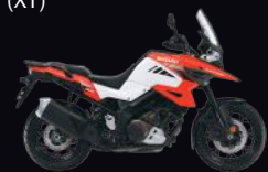
B1F: White / Orange (XT)