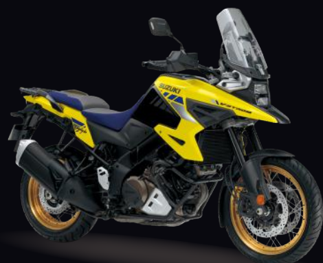
BT1: Yellow (XT)