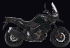
YVB: Glass Sparkle Black