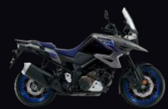
BD7: Black / Silver Grey (XT)